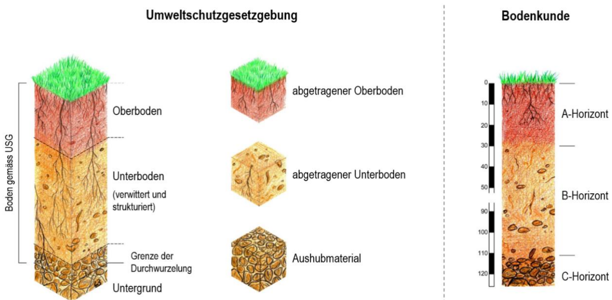
Abbildung 1 zeigt die unterschiedlichen Definitionen von Boden. Die bodenkundlich definierten Horizonte sind fachlich massgebend für die Festlegung des Rekultivierungsziels und für die Zielüberprüfung nach Abschluss des baulichen Eingriffs.

Die verschiedenen Definitionen des Bodens und der Geltungsbereich des USG