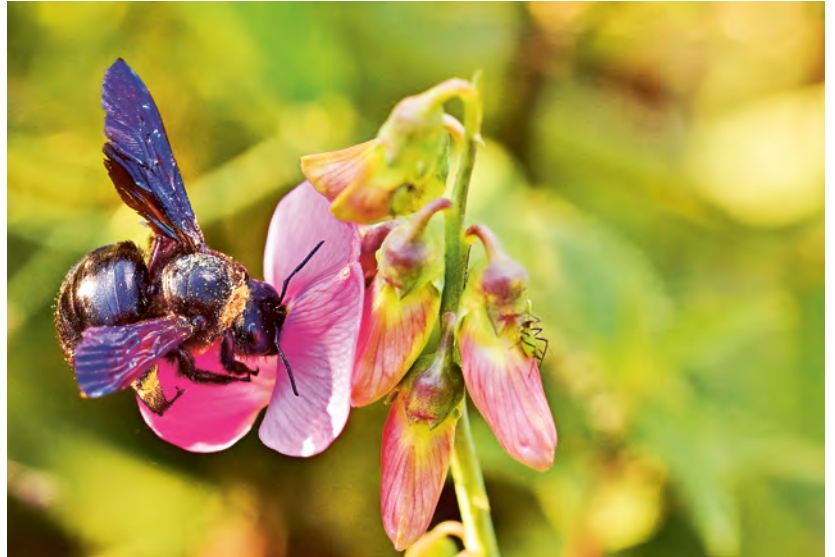
Bienen bestäuben bei der Nahrungssuche gleichzeitig Nutz- und Wildpflanzen. Finden sie nicht ausreichend Blüten, verhungern sie jedoch.

→ Artikel «Naturfreundlicher Böschungsunterhalt», Seite 15