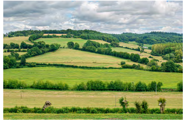
Von Strukturelementen und blühenden Hecken profitiert neben den Bienen auch die Biodiversität generell.

te im Kanton Zürich also hoch. Mit einer hohen Dichte steigt bei den Honigbienen aber auch das Risiko für die Ausbreitung infektiöser Krankheiten. Tatsächlich sind Krankheiten ein möglicher Faktor für das sogenannte «Bienensterben», von welchem in den vergangenen Jahren bei der Honigbiene berichtet wurde.