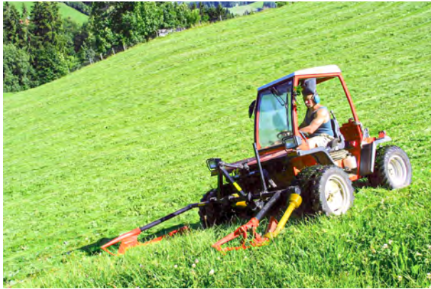
Wie gemäht wird, hat einen grossen Einfluss auf die Bienenpopulation (im Bild: Doppelmesserbalken).