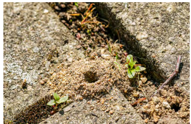
Wildbienen sind auf geeignete Nistplätze in der Nähe ihrer Nahrungspflanzen angewiesen. Geeignete offene Bodenstellen oder Strukturen können gezielt gefördert oder geschont werden.