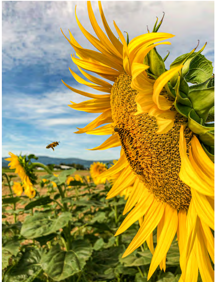
Wildbienen und Honigbienen sind für die Bestäubung der Kulturen gleichermaßen wichtig.

Vor allem Wildbienen sind darauf angewiesen, dass in der intensivierten Landschaft Strukturelemente an Stellen erhalten oder neu angelegt werden, welche als Nistplätze geeignet sind. Viele Wildbienen sind Bodennister und benötigen of-