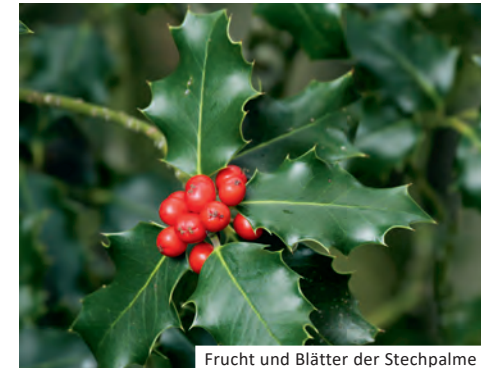
Frucht und Blätter der Stechpalme

Stechpalme ( Ilex aquifolium ): einheimisch, Blätter ebenfalls immergrün und ledrig, aber stachelig gezähnt, obere Blätter älterer Pflanzen auch ganzrandig – analog dem Kirschlorbeer, dunkelgrün glänzend, leuchtend rote, beerenartige Frucht