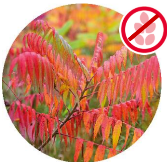
Herbstfärbung des Essigbaums