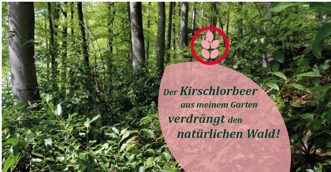
Plakat der Aktion: Gestaltung Agentur Umsicht, Foto Andreas Merz

Öffentliche Aktion auf dem Löwenplatz in Luzern 12. bis 18. September 2016